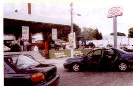
Kia de Teresina