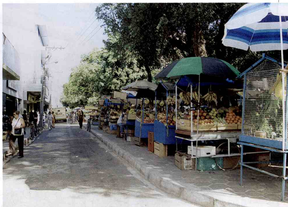
A praça ficou mais larga para abrigar fruteiros e ambulantes

A Rua Coelho Rodrigues já está liberada para o trânsito de veículos e um ponto de taxi foi colocado no local, para facilitar o acesso das pessoas, que preferem dei-